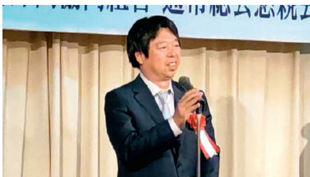
齋藤協同組合三条工業会理事長