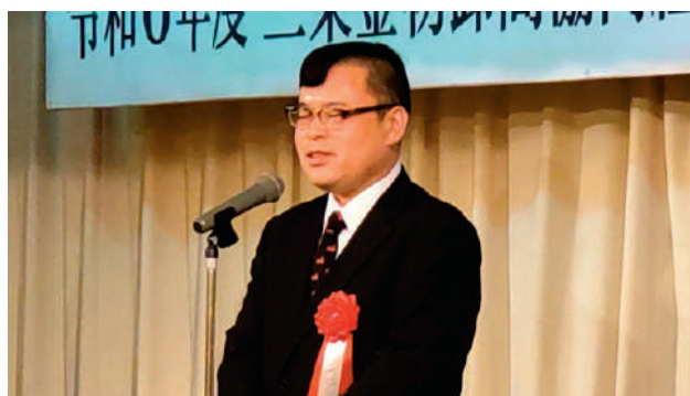
細川越後三条鍛冶集団会長