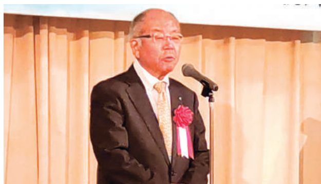
兼古三条商工会議所会頭