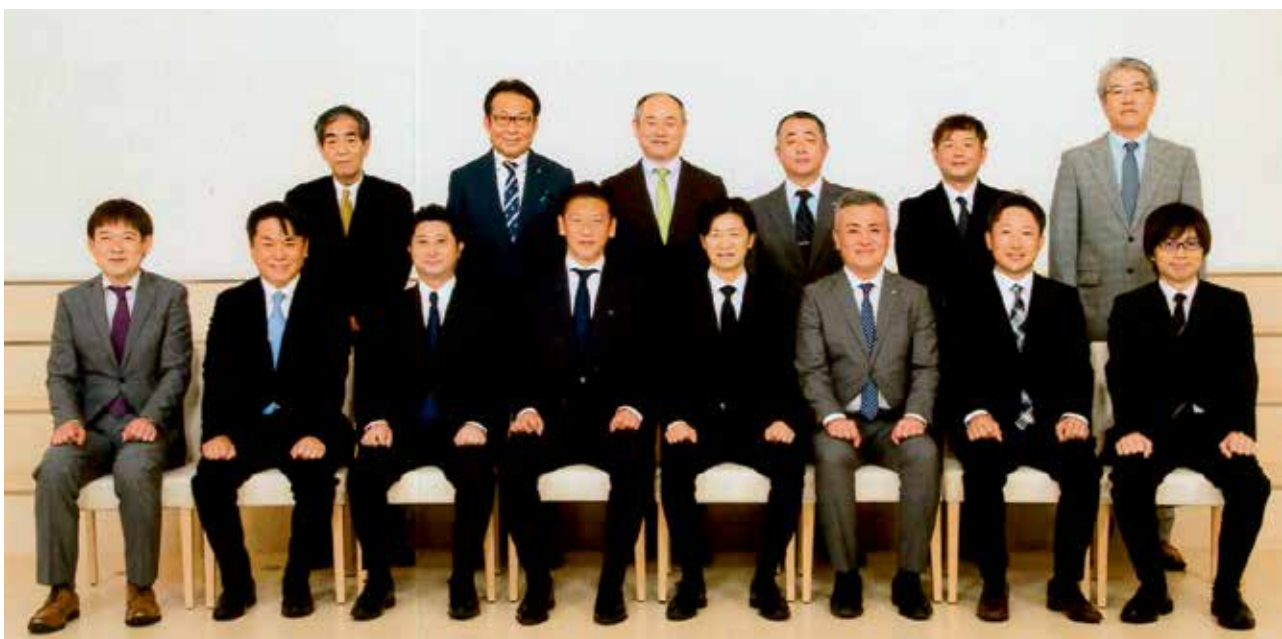
通常総会に出席した第15期 理事・監事