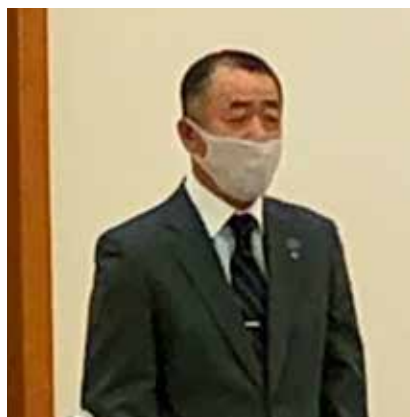
議事進行する長岡議長